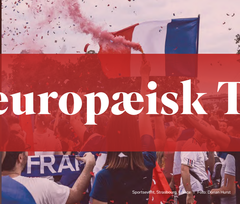
Sportsevent, Strasbourg, France