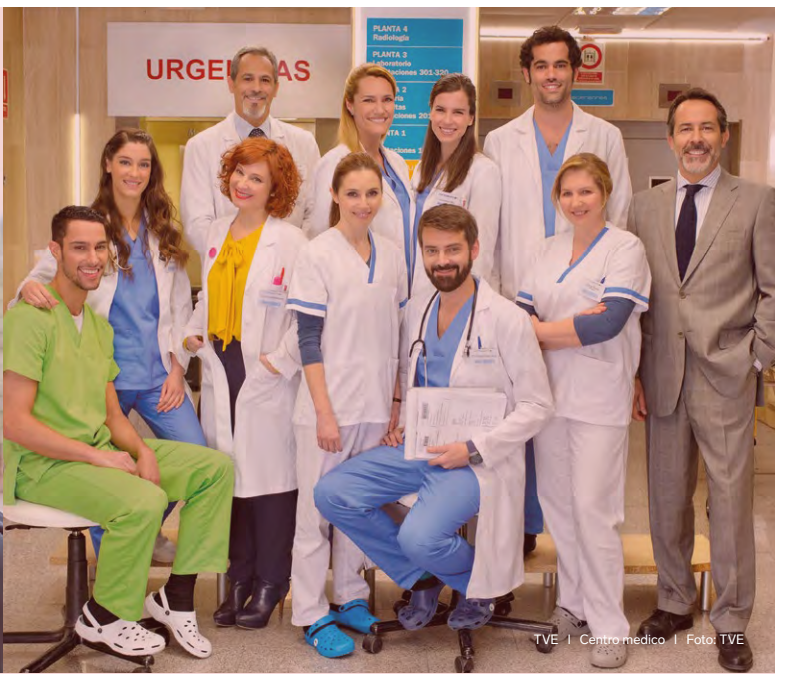
TVE | Centro medico