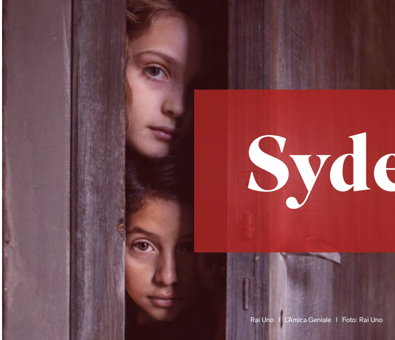
Rai Uno | L'Amica Geniale | Foto: Rai Uno