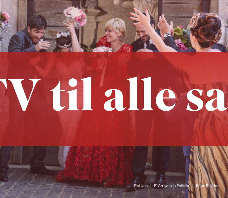
Rai Uno | E' Arrivata la Felicità