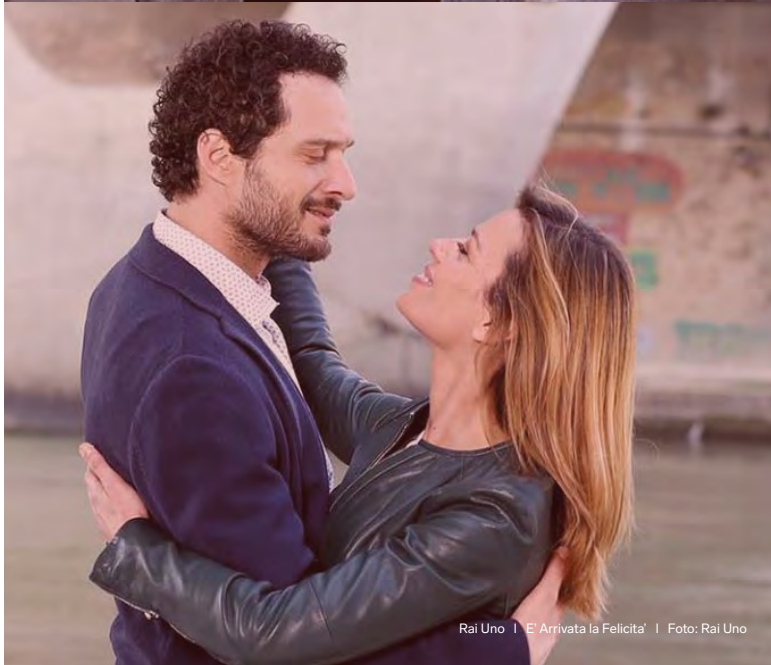
Rai Uno | E' Arrivata la Felicità