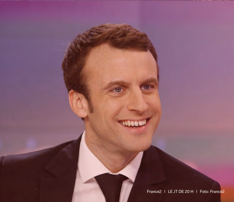
France2 | LE JT DE 20 H