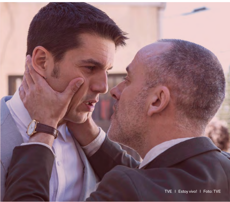
TVE | Estoy vivo!