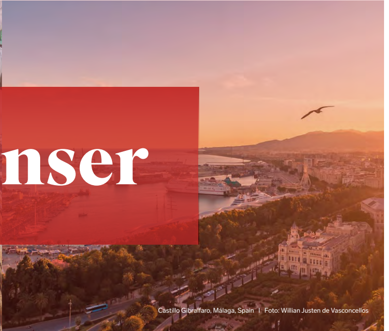
Castillo Gibralfaró, Málaga, Spain