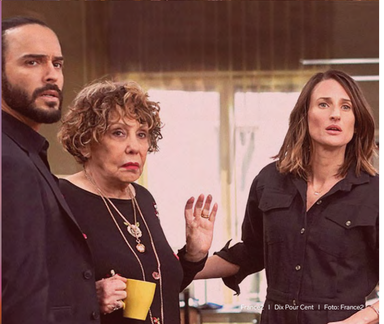
France2 | Dix Pour Cent