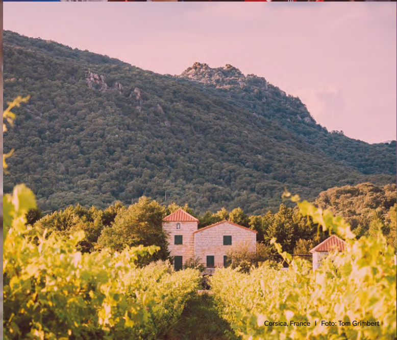
Corsica, France