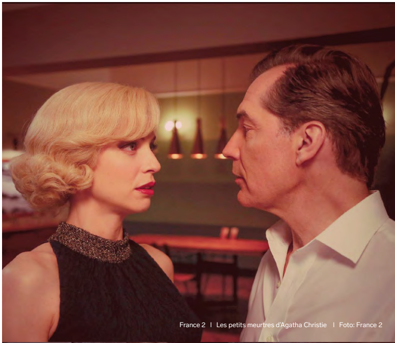
France 2 | Les petits meurtres d'Agatha Christie | Foto: France 2