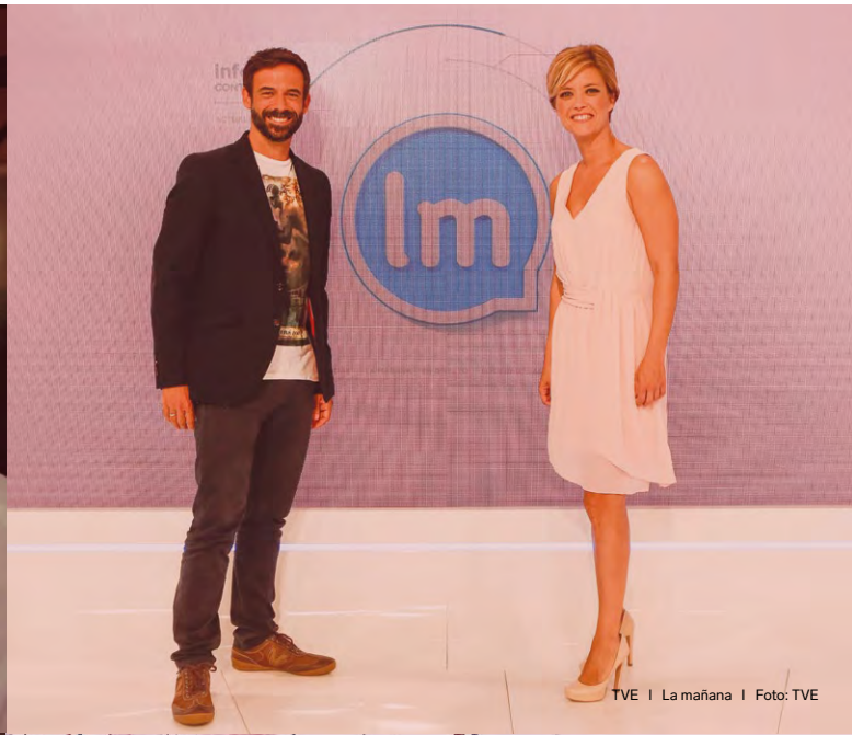
TVE | La mañana